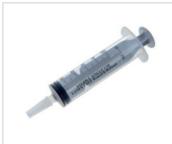
Seringas de 3 peças, de 60 ml

PT - Seringas de 3 peças Romed, de 60 ml, sem agulha, esterilizadas, com ponta de cateter, embaladas individualmente, 25 unidades numa caixa interior, 16 x 25 unidades = 400 unidades por embalagem.