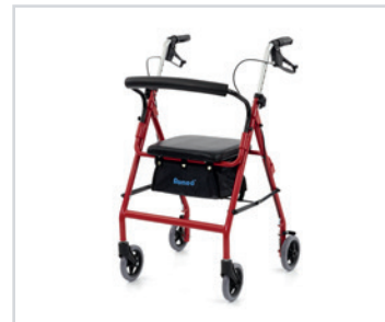
Andadeira em alumínio "Reliance"