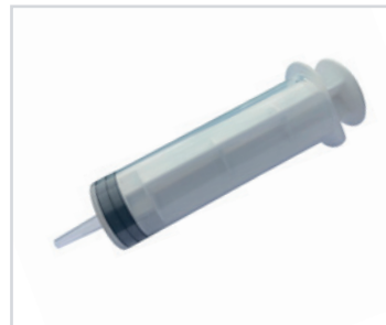
Seringas de 3 peças de 200ml

PT - Seringas de 3 peças Romed de 200ml sem agulha, estéreis, ponta do cateter ou luer lock, embaladas por unidade, em 10 unidades numa embalagem interior, 10 x 10 unidades = 100 unidades por caixa.