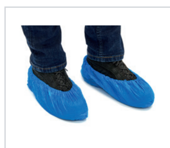
Capas para sapatos em CPE

PT - Capas para sapatos Romed em CPE, azuis, 0,05 mm, 150 x 360 mm, com 10 unidades num maço e 100 unidades numa embalagem múltipla, 200 x 10 unidades = 2000 unidades por embalagem.