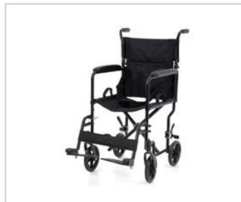
Cadeira para transporte "Glory"