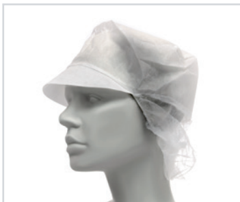
Toucas com elástico e pala

PT - Toucas Romed com elástico e com pala, em não-tecido, brancas, com 100 unidades numa caixa dispensadora, 4 x 100 unidades = 400 unidades por embalagem.