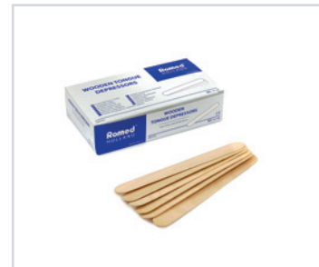
Espátulas de madeira

Embalagem: 0.012 cbm, 4.5 kgs 1 palette: 1.152 pcs (96 cartons) REF: CREAM-H