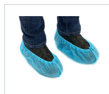
Capas para sapatos em não-tecido, antiderrapantes

PT - Capas para sapatos Romed, azuis, em não-tecido, antiderrapantes, tamanho: 16 x 38 cm, com 100 unidades numa embalagem múltipla, 10 x 100 unidades = 1000 unidades por embalagem.