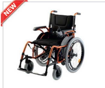
Cadeira de rodas elétrica

PT - Cadeira de rodas elétrica Romed, por unidade numa caixa de envio.