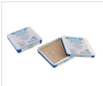
Gaze com parafina 10 x 10 cm

PT - Gaze com parafina Romed de 10 x 10 cm, esterilizada, embalada com 36 unidades numa caixa, 4 x 36 unidades = 144 unidades numa caixa interior e 9 x 36 unidades = 1296 unidades por embalagem.