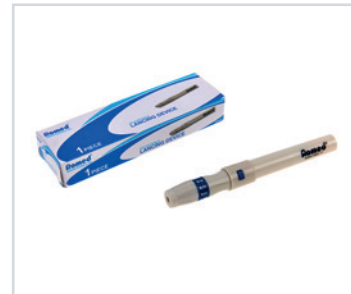
Suporte-caneta para lancetas

PT - Suporte-caneta Romed para lancetas com bisel triplo, (BL-100TB), embaladas individualmente numa caixa, 100 unidades por embalagem.