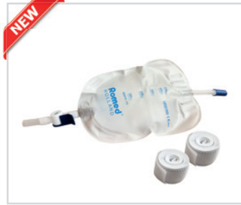
Sacos de urina para perna com 750ml

PT - Saco suave de urina Romed para perna, 750ml com válvula anti-retorno e torneira, estéril, embalado por unidade, 10 unidades numa embalagem, 80 unidades por caixa de envio.