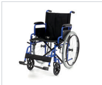
Cadeira de rodas manual "Dynamic"