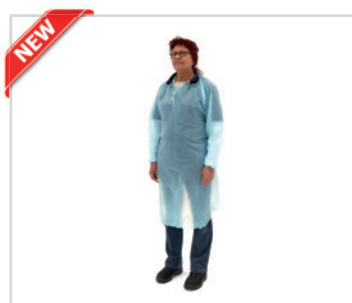
Batas-aventais de PE

PT - Batas-aventais de PE Romed, azuis, 170x116cm por unidade numa embalagem plástica, 10 unidades numa embalagem interior, 30 x 10 unidades = 300 unidades por caixa.