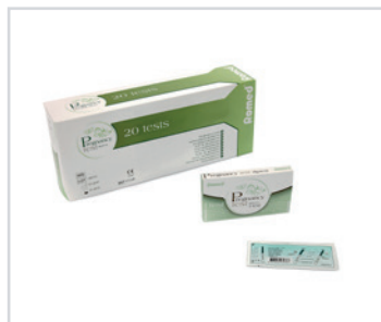
Teste de gravidez

Embalagem: 0.015 cbm, 6 kgs 1 palette: 13.000 pcs (13 cartons) REF: PT-DIP1000