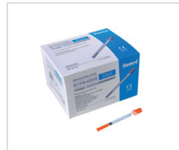
Seringas de insulina

PT - Seringas de insulina Romed com agulha integrada, esterilizadas, embaladas individualmente, com 100 unidades numa caixa interior, 32 x 100 unidades = 3200 unidades por embalagem.