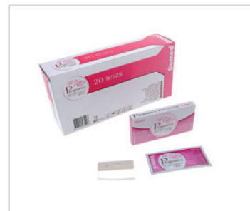
Teste de gravidez, em cassete

Embalagem: 0.058 cbm, 11 kgs 1 palette: 24.000 pcs (24 cartons) REF: PT-CAS1000