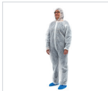
Overalls with capuchin

Embalagem: 0.037 cbm, 4 kgs 1 palette: 14.000 pcs (36 cartons) REF: SN-CAP-W