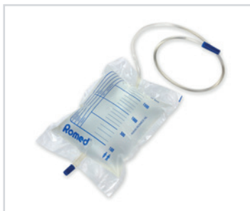
Sacos de urina, de 2 l, com VNR e ODB

PT - Sacos de urina Romed, de 2 litros, com válvula de não retorno e orifício de descarga na base, tubo de 90 cm, embalados individualmente, numa embalagem múltipla, 250 unidades por embalagem.