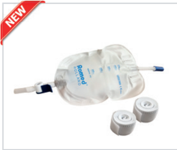
Sacos de urina para perna com 500ml

PT - Saco suave de urina Romed para perna, 500ml com válvula anti-retorno e torneira, estéril, embalado por unidade, 10 unidades numa embalagem, 80 unidades por caixa de envio.