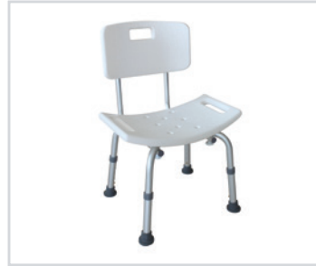
Cadeira para o banho com apoio de costas

PT - Cadeira para o banho Romed em alumínio, com apoio de costas, orifícios para escorrer a água e proteção antiderrapante.