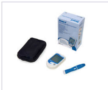
Medidores de glicémia

PT - Medidores de glicémia completos Romed (incl. medidor, dispositivo de punção e estojo de transporte), embalados individualmente, 15 unid. por caixa interior, 4 x 15 unid. = 60 unid. por caixa.