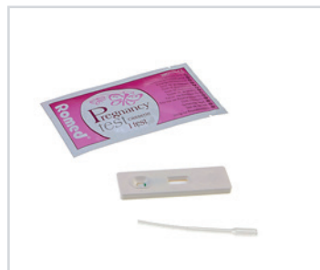
Teste de gravidez, em cassete

Embalagem: 0.018 cbm, 10.5 kgs 1 palette: 10.000 pcs (20 cartons) REF: PT-DIP