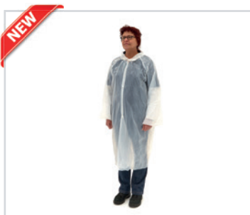
Bata branca de PE para visitante

PT - Bata branca de PE para visitante Romed 150x115cm por unidade numa embalagem plástica, 50 unidades numa embalagem interior, 10 x 50 unidades = 500 unidades por caixa.