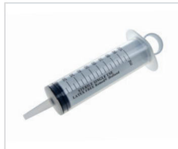
Seringas de 3 peças, de 100 ml

PT - Seringas de 3 peças Romed, de 100 ml, sem agulha, esterilizadas, com ponta de cateter, embaladas individualmente, 25 unidades numa caixa interior, 4 x 25 unidades = 100 unidades por embalagem.