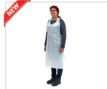
Aventais de polietileno, pack de 100 unidades

Embalagem: 0.047 cbm, 5 kgs 1 palette: 1.500 pcs (30 cartons) REF: VC-L, XL, XXL