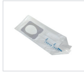
Sacos de urina pediátricos

PT - Sacos de urina pediátricos Romed, embalados individualmente, numa embalagem múltipla, 100 unidades numa caixa interior, 20 x 100 unidades = 2000 unidades por embalagem.