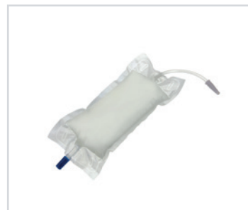
Sacos de urina para a perna, de 750 ml

ES - Bolsas de orina para pierna Romed, de 500 ml, con válvula antirretorno (NRV) y de salida, tubo de 45 cm, esterilizado, una unidad por bolsa, 250 unidades por paquete.