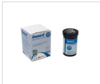
Fitas-teste para glicemia

PT - Caixa de tiras-teste de glicémia Romed, 50 tiras por frasco, um frasco numa caixa de tiras-teste, 10 caixas de tiras-teste por caixa interior, 20 caixas interiores = total 200 caixas de tiras-teste por caixa