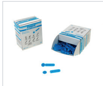
Lancetas com bisel triplo

PT - Lancetas Romed com bisel triplo, calibre fino, azuis, esterilizadas, embaladas individualmente, 100 unidades numa caixa dispensadora, 5000 unidades numa caixa interna, 4 x 5000 unidades = 20 000 unidades por embalagem.