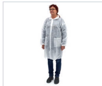
Batas para visitantes

Embalagem: 0.063 cbm, 6 kgs 1 palette: 1.000 pcs (20 cartons) REF: OVE-S,M,L,XL,XXL