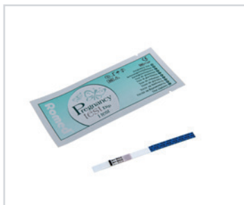
Teste de gravidez

PT - Testes de gravidez Romed, fitas para mergulhar, embalagem de unidades soltas, 1000 unidades por embalagem.