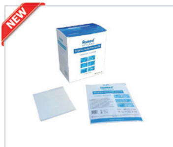
Paraffine gauze packed per piece

Embalagem: 0.031 cbm, 8.5 kgs 1 palette: 2268 containers (63 cartons) REF: PARAF-10X10