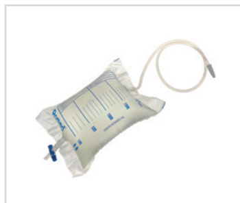
Sacos de urina, de 2 l, com VNR e válvula em T

ES - Bolsas de orina Romed, de 2 l, con válvula antirretorno (NRV) y de salida, tubo de 90 cm, una unidad por bolsa, esterilizado, 250 unidades por paquete.