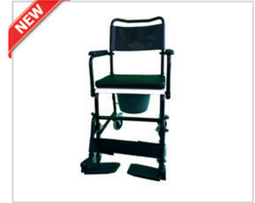
Cadeira cómoda, móvel

PT - Cadeira cómoda móvel Romed, por unidade numa caixa de envio