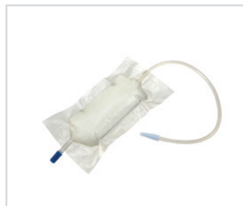
Sacos de urina para a perna, de 500 ml

ES - Bolsas de orina para pierna Romed, de 2 l, con válvula antirretorno (NRV) y combinación de salida, tubo de 90 cm, una unidad por bolsa, esterilizado, 250 unidades por paquete.