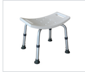
Cadeira para o banho sem apoio de costas

PT - Cadeira para o banho Romed em alumínio, sem apoio de costas, com orifícios para escorrer a água e proteção antiderrapante.